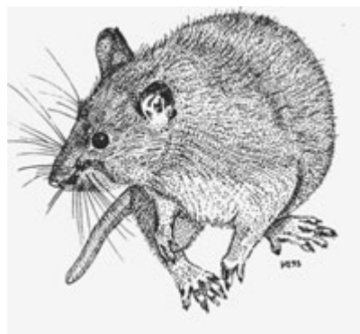
Tegning: Karl-Martin Vagn Jensen

Rotten er ret altædende, men foretrækker normalt kornprodukter. Den æder daglig en fødemængde, der svarer til ca. 1/10 af dens egen legemsvægt. I modsætning til mus, som klarer sig fint på helt tørre steder, skal rotten have adgang til drikkevand. Rotten klatrer og svømmer udmærket, men dens vigtigste redskaber er dog de store, mejselformede fortænder, som kan gnave i alt, der er mindre hårdt end jern - hvis bare tænderne kan få fat.