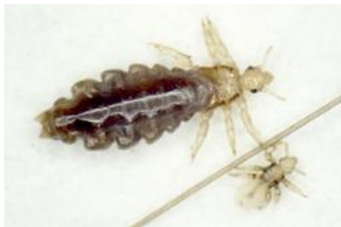
Voksen hovedlus og lille nymfe på hårstrå. Naturlig størrelse for den voksne er 2-3 mm.

Hovedlus er små, flade, aflangt ovale insekter. De voksne hovedlus er 2-3 mm lange; hunnerne er større end hannerne. De nyklækkede lus er kun 0,5 - 1 mm. Lus har tre par ben forrest på kroppen, de har ikke vinger, og de kan hverken flyve eller hoppe. På hovedet har de et par antenner, små øjne og munddele, der er bygget til at bide og suge blod med. Hvert ben ender i en klo, der er specialiseret til at gribe om et hårstrå. Lusenes farve kan variere fra nærmest gennemsigtig gråhvid til meget mørk. Denne variation skyldes, at lusene kan forekomme mere mørke lige efter, at de har suget blod.